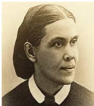
Елън Уайт призовава за реорганизация

Мъже, които изповядват благочестие, са презрели Христос в лицето на Неговите вестители. Както юдеите, те отхвърлят Божията вест. Юдеите питали относно Христос, "Кой е този? Не е ли това синът на Йосиф?" Той не бил онзи Христос, който юдеите търсели. Така и днес, инструментите, които Бог изпраща, не са това, което хората търсят. Основи на християнското възпитание – стр. 472, 1897 г.