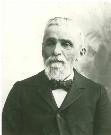
Дж. Н. Лафбъроу

Аз получих инструкция от Господ , че в това време [1] ние трябва да смирим душите си пред Бога. [2] Трябва внимателно да изучим настоящата ситуация. [3] Не трябва да изпращаме нашите мъже с опит и разбиране, така че да оставят крепостта без защита. В Батъл Крик имаме нужда от мъже, които знаят кога да говорят и кога да мълчат. [4] Едно мощно свидетелство трябва да се дава там през цялото време относно подходящата организация. Нашите братя на отговорни длъжности там трябва да бъдат обучени по този въпрос и да бъдат учени как да издават определен звук с тръбата. Крайно време е да застанем на стража, облечени във всеоръжието на Бога.