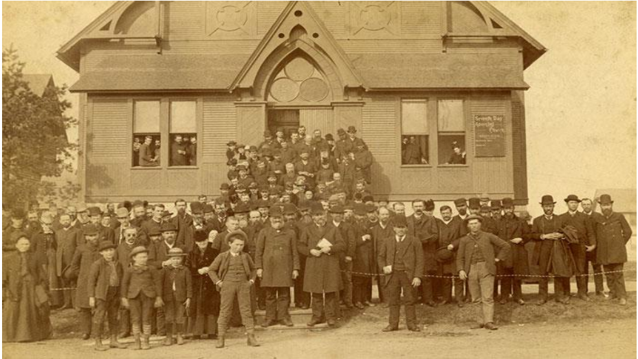
Конференцията в Минеаполис през 1888 г.